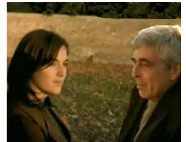
2003 LES JOURS OÙ JE N'EXISTE PAS de Jean-Charles Fitoussi avec Clémentine Baert