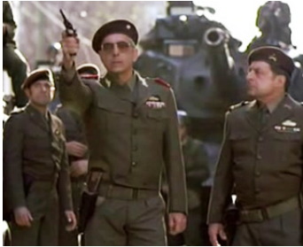
2000 CAPITAINES D'AVRIL (Capitães de Abril) de Maria de Medeiros