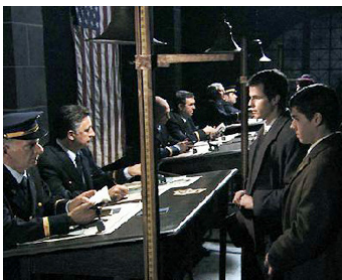
2007 CHRISTOPHE COLOMB, L'ÉNIGME de Manoel de Oliveira avec Ricardo Trepa