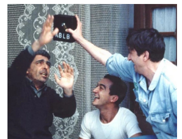
1994 LA CASSETTE (A Caixa) de Manoel de Oliveira avec Diogo Dorio, Ruy de Carvalho