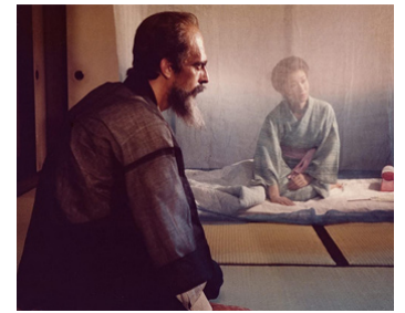
1982 L'ÎLE DES AMOURS (A Ilha dos Amores) de Paulo Rocha avec Yoshiko Mita