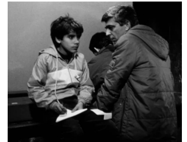
1989 LE SANG (O Sangue) de Pedro Costa avec Nuno Ferreira