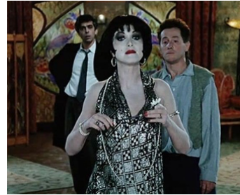
1986 MON CAS (O meu caso) de Manoel de Oliveira avec Bulle Ogier, A. Bogousslavsky