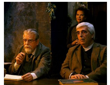
2012 GÉBO ET L'OMBRE de Manoel de Oliveira avec Michael Lonsdale, Claudia Cardinale