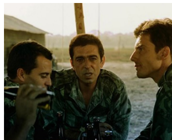
1990 NON OU LA VAINE GLOIRE DE COMMANDER (Non') de Manoel de Oliveira