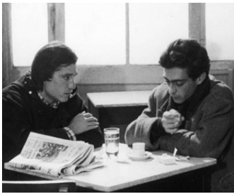
1970 QUEM ESPERA POR SAPATOS DE DEFUNTO MORRE DESCALÇO de João Cesar Monteiro