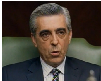
2002 DANCER UPSTAIRS (The Dancer upstairs) de John Malkovich