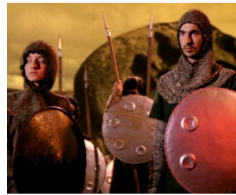
1982 SILVESTRE (Silvestre) de João César Monteiro avec Maria de Medeiros