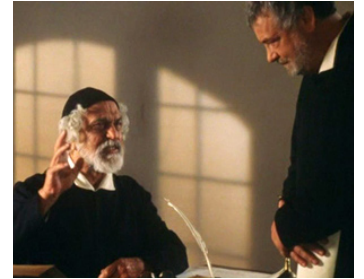
2000 PAROLE ET UTOPIE (Palavra e Utopia) de Manoel de Oliveira avec Lima Duarte