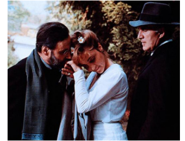
1987 TERRE ÉTRANGÈRE (Das weite Land) de Luc Bondy avec Bulle Ogier, M. Piccoli