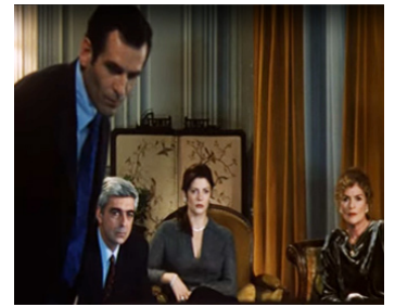
1999 LA LETTRE (A Carta) de Manoel de Oliveira avec Antoine Chappey, Chiara Mastroianni