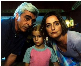
2003 UN FILM PARLÉ (Um Filme falado) de Manoel de Oliveira avec Leonor Silveira