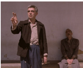
1989 SOUVENIRS DE LA MAISON JAUNE (Recordações da Casa Amarela) de J.C. Monteiro