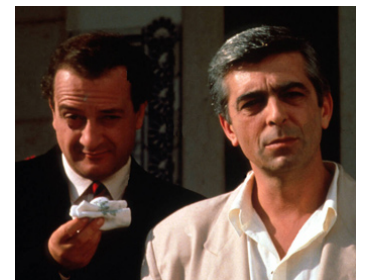
1991 LA DIVINE COMÉDIE (A Divina Comédia) de Manoel de Oliveira avec Paulo Matos