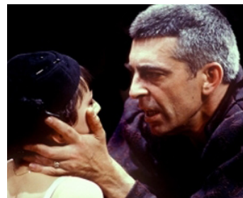
1991 LA MORT DU PRINCE (A Morte do Principe) de et avec Maria de Medeiros