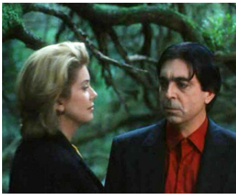
1995 LE COUVENT (O Convento) de Manoel de Oliveira avec Catherine Deneuve